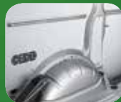
Bsp. Verzurr- schiene an den Seitenwänden