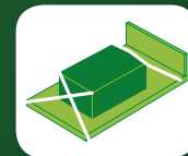
Bsp. Direktzurren/ Diagonalzurren