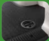
Bsp. Verzurröse: Befestigung von Ladung am Innenraumboden

Sie werden in unseren Fahrzeugen Verzurrösen bzw. Verzurr-schiene vorfinden. Diese dienen zur Befestigung Ihrer Ladung.